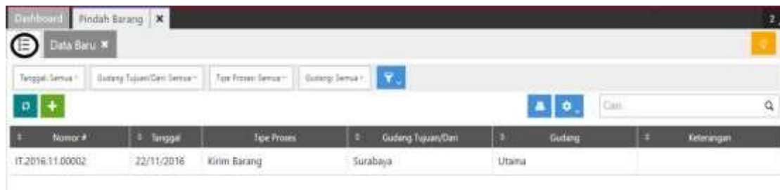
Gambar 2. Tampilan Pindah Gudang