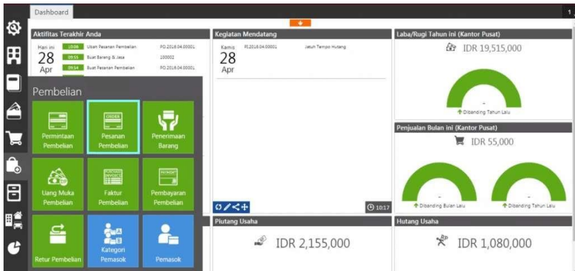
Gambar 3. Tampilan Modul Pesanan Pembelian