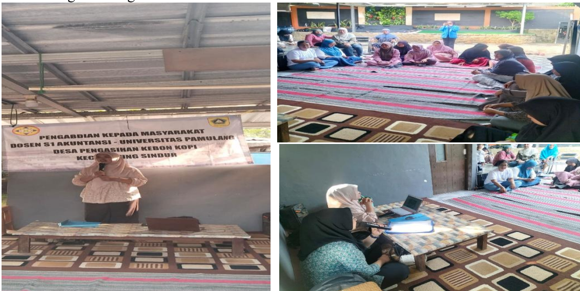
Gambar 2. Foto Pelaksanaan Pengabdian Masyarakat

Hasil Pengabdian kepada Masyarakat di Rukun Warga 007 berdasarkan observasi, dan wawancara yang dilakukan selama kegiatan menunjukkan bahwa masih banyak peserta yang belum memahami dan membedakan Fintech Legal dan Ilegal yang ada di Indonesia. Hal ini terlihat dari beberapa pertanyaan yang diajukan oleh peserta dalam kegiatan tersebut. Berikut ringkasan kegiatan PKM: