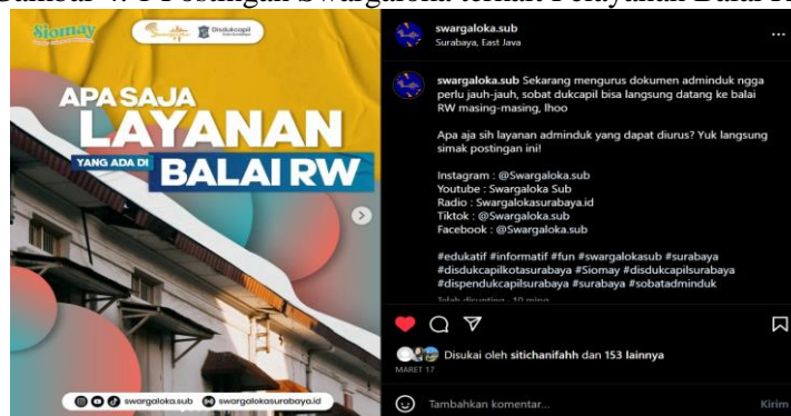
Gambar 4. 1 Postingan Swargaloka terkait Pelayanan Balai RW