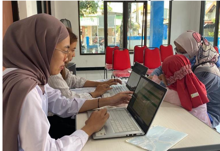
Gambar 1 Pelayanan Sayang Warga